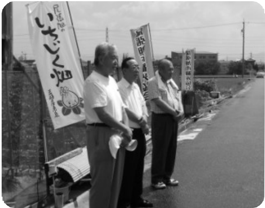
いちじく収穫祭にて

今年のいちじくワインの出荷は11月初め頃になる予定で、市内の販売店店頭、JA、イベントテントなどで売り出されます。どうぞおたのしみに!!